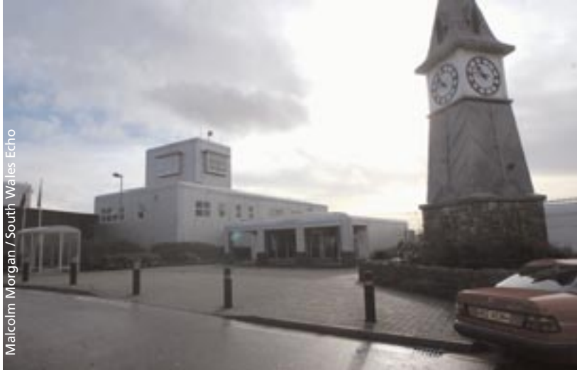
▲ Carchar EM/Sefydliad Troseddwy Ifanc Parc, un o'r tri charchar a archwiliwyd yn ein hymchwiliad ffurfiol o Wasanaeth Carcharau EM.

oedd Carchar EM/Sefydliad Troseddwy Ifanc Parc, ger Pen-y-bont ar Ogwr yn Ne Cymru.