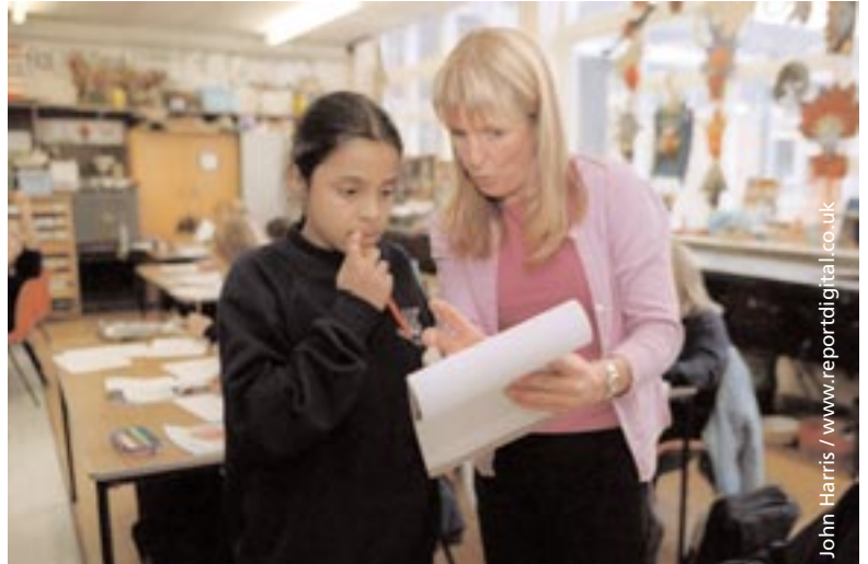
John Harris / www.reportdigital.co.uk

Buom hefyd yn cryfhau ein perthynas ag asiantaethau cyfiawnder troseddol eraill. Yn dilyn ymweliad â Charchar Caerdydd, cawsom wahoddiad i ymuno â'i dîm rheoli cysylltiadau