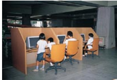
Corredor del piso inferior (Zona de entrada libre)