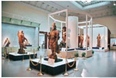
Salas de exposición del edificio principal