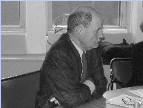
Olof Hultén, SVT