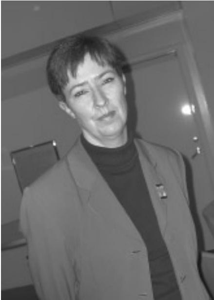
Statsrådet Mona Sahlin talade om målen för integrationspolitiken på SCB:s konferens den 8 februari