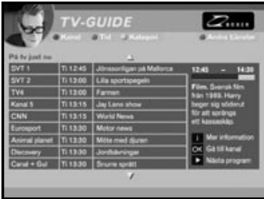
Ett exempel på hur en elektronisk programguide kan se ut. Figuren är hämtad från rapporten "Utvecklingen av elektroniska programguider (EPG) och tillämpningsprogram (API) på den svenska digital-TV-marknaden".

OPERATÖRERNAS SÄTT ATT ANVÄNDA ELEKTRONISKA PROGRAMGUIDER UTGÖR INGET HINDER för programbolagen att nå TV-konsumenterna med information om sitt programutbud, konstaterar Radio- och TV-verket efter genomförd undersökning. Verket anser inte att det finns anledning att i dagsläget föreslå någon hårdare reglering av området.